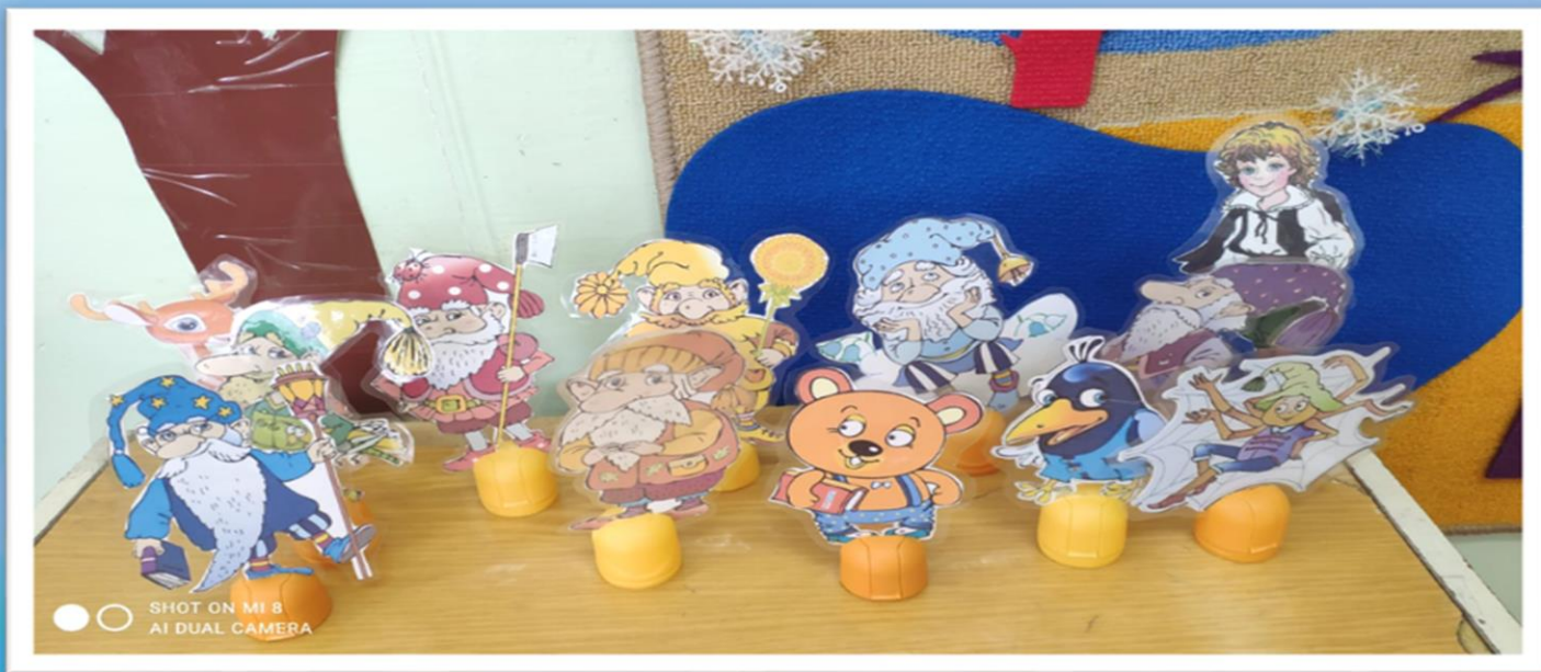
Сказочные персонажи изготовлены своими руками